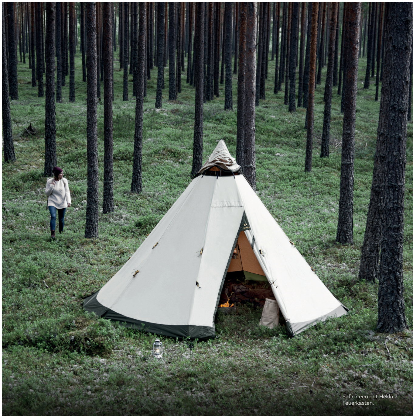
Safir 7 eco mit Hekla 7 Feuerkasten.